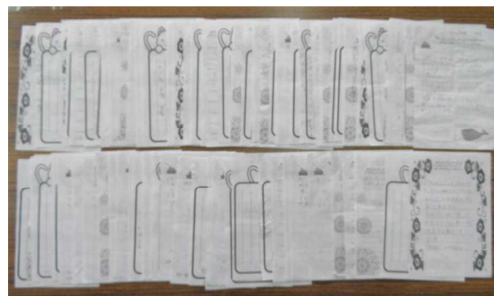
← 投稿された約100枚のお手紙