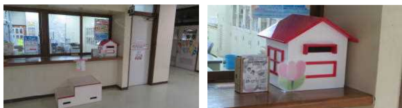
事務室前のハッピーボックス

なお、実際に入っていたお手紙は、職員室近く・事務室横(10組側)の掲示板に掲示する予定です。