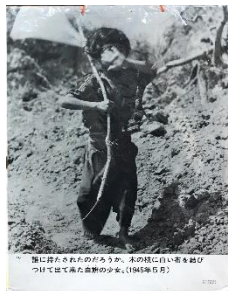
旗に誓った少女の姿。この写真は、1945年6月23日に撮影されたものである。

とても有名な日旗の少女の写真です。この写真が撮られた時、7歳だったそうです。みなさんと同じくらいの年齢の時に戦争を体験した少女は何を感じていたのでしょうか。日旗の少女については本にもなっています。ぜひ読んでみましょう。