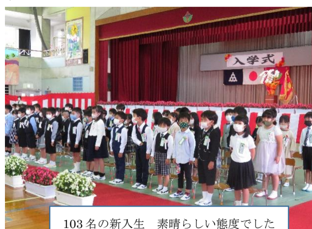
103名の新入生 素晴らしい態度でした