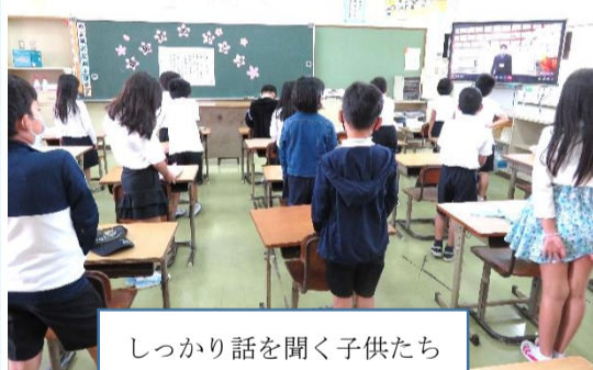
しっかり話を聞く子供たち