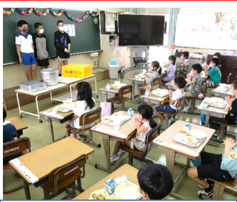
4/12から給食開始 6年生がお手伝い

やる気あふれる新入生の姿に、職員一同「この子たちをより良く育まなければ」という使命感が益々強くなりました。