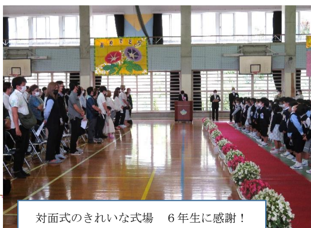
対面式のきれいな式場 6年生に感謝!