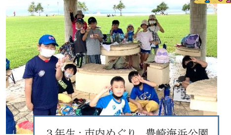
3年生：市内めぐり、豊崎海浜公園