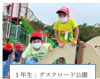
1年生：グスクロード公園