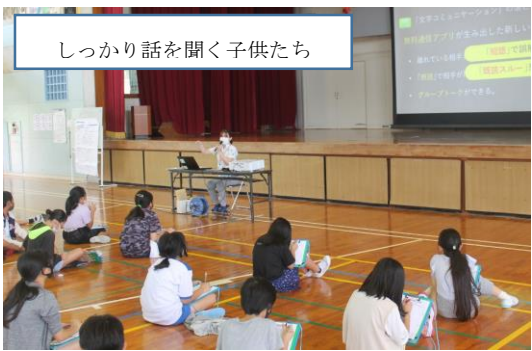
しっかり話を聞く子供たち

最近の報道などで頻繁に伝えられている様に、スマホによって危ない目にあうことが増えています。ぜひ、ご家庭でも今一度、使い方や約束などご確認ください。