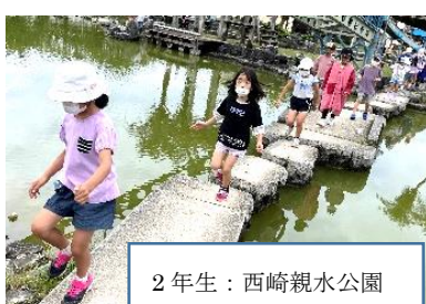
2年生：西崎親水公園