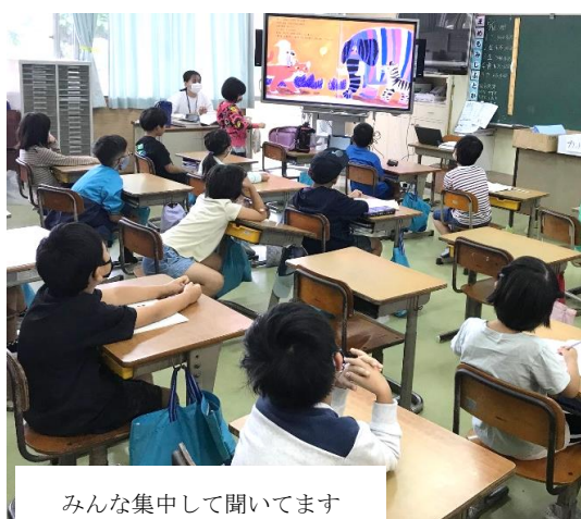
みんな集中して聞いてます